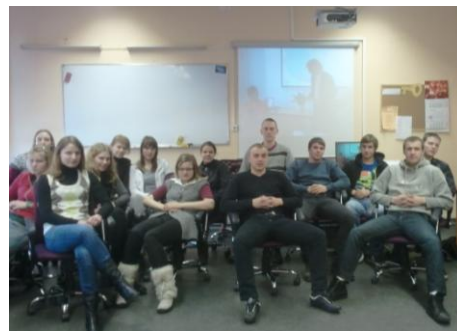
12. b klase E-prasmju nedēļas atklāšanas brīdī

Arī mūsu skolas skolēni nebija kūtri un atbalstīja šo jau par tradīciju kļuvošo pasākumu nedēļas garumā. Viņi pildīja Lattellecom testu mājas lapā http://www.piesledzieslatvija.lv/lv/macies-pats/ , lai novērtētu savas pamatprasmes informācijas tehnoloģijās, veidoja prezentācijas, lai iepazīstinātu klasesbiedrus ar tādām interesantām un saistošām mājas lapām kā http://www.ss.lv/ , http://csnt.csdd.lv/ , piedalījās „Lielajā tautas skaitīšanā”, kā arī veica citus interesantus uzdevumus, lai iepazītos ar interneta sniegtajām priekšrocībām. 12. klašu skolēni mājas lapā http://www.uzdevumi.lv cītīgi gatavojās CE.